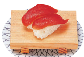
ミニ長角盛台(すべり止め付)