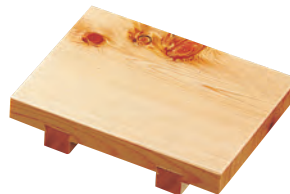
桧ミニ紅節長角盛台(すべり止め付)