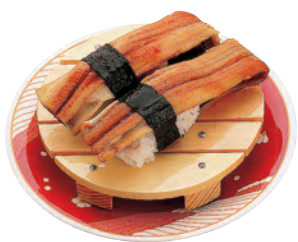
白木寿司皿(B)(すべり止め付)

19-208-06 (30351) 1,250円 約12×9×H2cm ※すべり止め加工はしてありません。