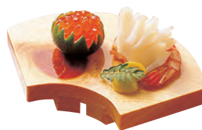
桧・紅節ミニ盛台 扇型(すべり止め付)

19-208-08 (25759) 1,300円 約14.5×9.5×H2.5cm