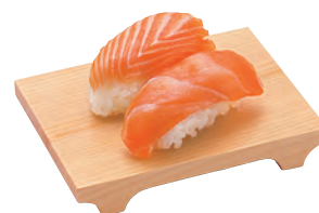
東濃檜・盛皿ミニ

19-208-06 (30351) 1,250円 約12×9×H2cm ※すべり止め加工はしてありません。